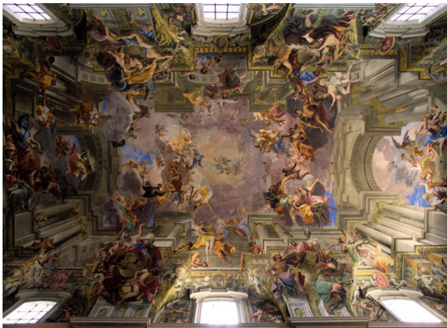
FIGURA 3 Andrea Pozzo, Opera missionaria della Compagnia di Gesù o Trionfo di Sant'Ignazio , volta della navata centrale. Chiesa di Sant'Ignazio, Roma.

con lo spazio storico. Il fulcro della rappresentazione è Sant'Ignazio, da cui irradia una luce che si estende ai confini della volta come la sua opera evangelizzatrice si allarga agli estremi confini della terra, rappresentata dalle personificazioni dei continenti di missione. L'affresco sembra attraversato da sei fasci di luce, il primo dei quali parte dal costato di Cristo e giunge al cuore di Ignazio; da qui si rifrange in cinque direzioni, sui quattro continenti e infine, in basso, su un grande specchio recante la scritta IHS e sorretto da un angelo.