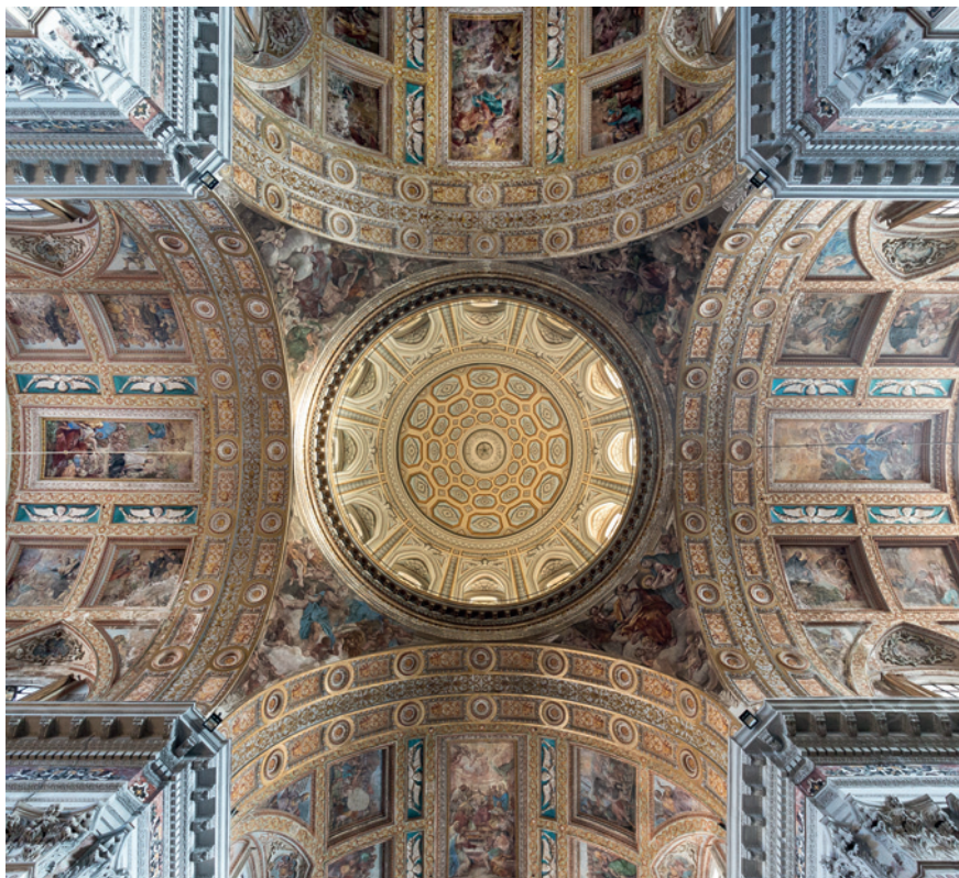
FIGURA 4 Incrocio delle volte. Chiesa del Gesù Nuovo, Napoli.

ideare e realizzare l'apparato degli affreschi, oggi frammentario. Il Santo epónimo della cappella, Francesco De Geronimo, è protagonista del gruppo scultoreo centrale, scolpito nel 1932 da Francesco Jerace. Chiamata anche "Cappella della Lipsanoteca", le sue pareti laterali ospitano due monumentali pannelli-reliquario in legno dorato, realizzati dall'architetto, nonché argentiere e scultore, Giovan Domenico Vinaccia alla fine del XVII secolo. Di impressionante suggestione visiva, la cappella presenta su ciascuna parete 34 grandi busti che contengono reliquie dei Santi, molte delle quali dono della benefattrice principessa di Bisignano. Al centro dei pannelli, le statue lignee di Sant'Ignazio di Loyola e di San Francesco Saverio (Figura 5). 34