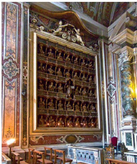
FIGURA 5 G. D. Vinaccia, cappella Ravaschieri. Chiesa del Gesù Nuovo, Napoli.

fedeli ed ai pellegrini, per renderlo accessibile e fornire un'immagine presente e reale della famiglia dei Santi e della città di Dio. Il reliquiario è la casa terrena del Santo, ma i preziosi materiali di cui è fatto rinviano anche alla "città celeste" come vera patria del Popolo di Dio.