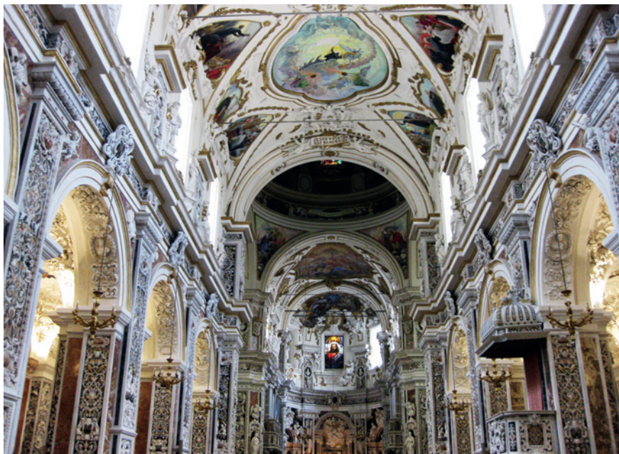
FIGURA 6 Chiesa del Gesù di Casa Professa, Palermo (con autorizzazione del F.E.C.).