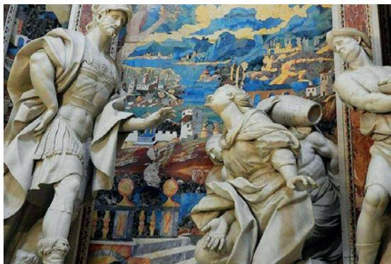
FIGURA 8 Storie di David , “teatro” della zona presbiterale. Chiesa del Gesù di Casa Professa, Palermo (con autorizzazione del F.E.C.).

ai Misteri gaudiosi ed alla II settimana di Esercizi spirituali; nella navata di sinistra (lato S. Ignazio), invece, gli affreschi mostrano episodi della Passione, in accordo ai Misteri dolorosi ed alla III settimana di Esercizi. Anche l'apparato scultoreo di angeli e trionfi fitomorfi si accorda con i temi pittorici, lieti o tristi.