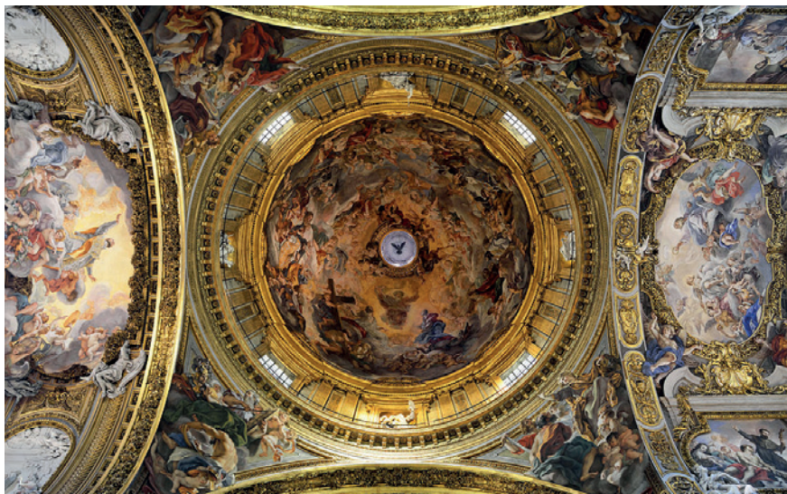
FIGURA 2 G. B. Gaulli, “Il Baciccia”, Trionfo dell’Eucarestia , cupola della navata centrale. Chiesa del Gesù, Roma (con autorizzazione del F.E.C.).

il monumentale squarcio in cui si staglia il “Trionfo della Provvidenza” realizzato da Pietro da Cortona tra il 1632 ed il 1639 a Palazzo Barberini a Roma. 19 Il Baciccia imposta una visione simile sull’intera navata centrale del Gesù, in un fantasmagorico trompe-l’oeil.