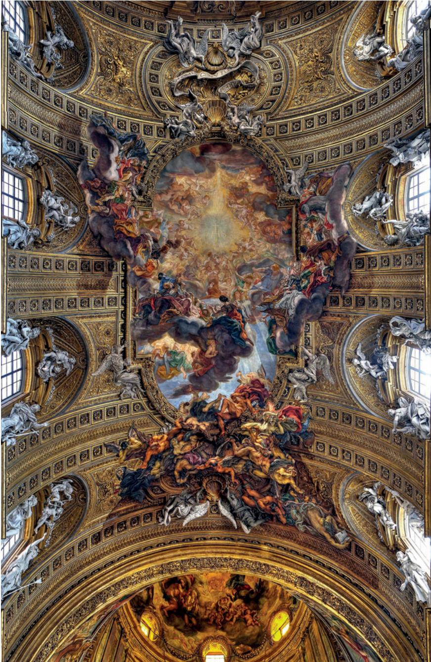
FIGURA 1 G. B. Gaulli, detto "Il Baciccia", Trionfo del Nome di Gesù , volta della navata centrale. Chiesa del Gesù, Roma (con autorizzazione del F.E.C.).