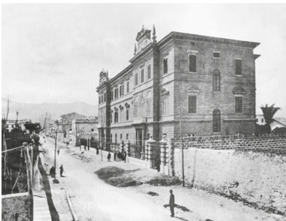
Nuovo Manicomio di Palermo. Edificio dell'amministrazione e ingresso monumentale, in una foto dei primi del Novecento.