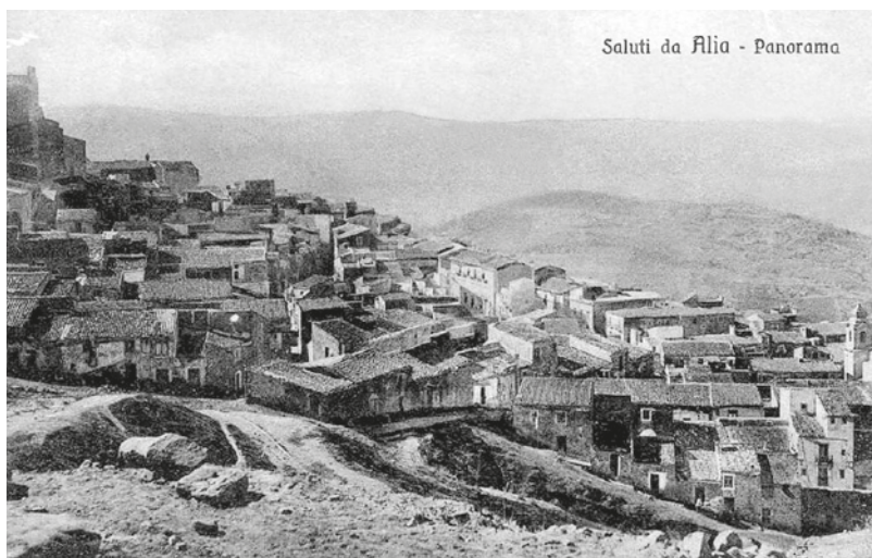
Alia (Palermo), panorama, cartolina dei primi anni del Novecento.