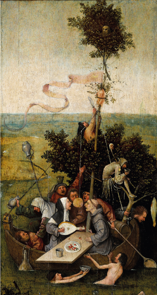
Hieronymus Bosch, "La nave dei folli", 1490.