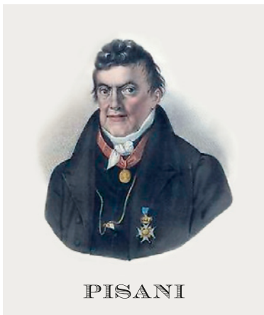
Barone Pietro Pisani (litografia acquarellata, disegnata e incisa dal litografo Dollino, 1859 ca).

Onorerà la memoria del figlio dando alle stampe il suo saggio che nel 1817 uscirà contemporaneamente a Napoli e a Palermo.