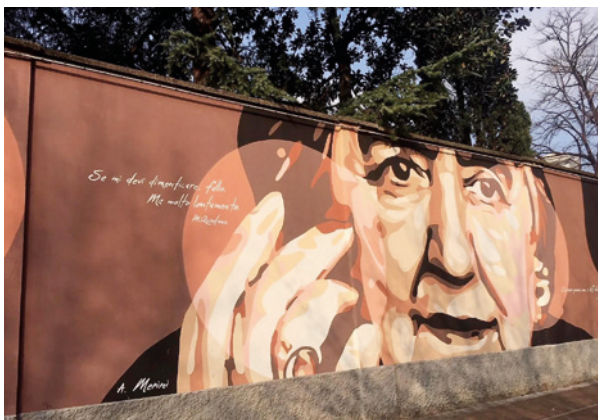
Progetto "Milano WallArt" del 2014, opera realizzata da Orticanoodles (Walter Contipelli e Alessandra Montanari), in piazza Cardinal Ferrari – zona Crocetta – raffigurante i volti più significativi della cultura milanese come Alda Merini.

– [...] Quell'uguale belato era fraterno al mio dolore. Ed io risposi, prima per celia, poi perché il dolore è eterno, ha una voce e non varia [...] –